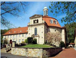
Kloster Orbeck in Georgsmarienhütte

500 m 2 Dämmhülsenverfahren, mit Zellulose Einblasdämmung