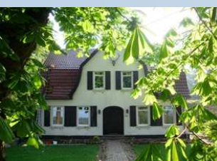
Einfamilienwohnhaus in Vrees (Altes Försterhaus)

Kerndämmung Rigibead, Zellulosedämmung im Dachraum