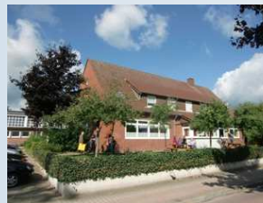
Gemeinde Geeste Ludgerischule Gr. Hesepe