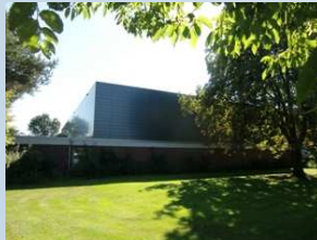
Landkreis Cloppenburg Turnhalle Friesoythe