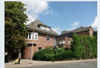
Verein Lotse e.V. Liegenschaft in Meppen