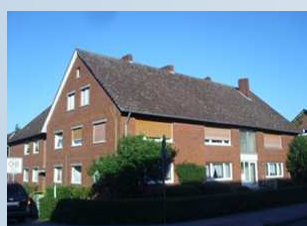
Mehrfamilienwohnhaus in Meppen

Kerndämmung Rigibead, Keller- und Geschossdeckendämmung