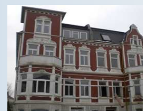
Mehrfamilienwohnhaus in Oldenburg

Kerndämmung Rigibead, Keller- und Geschossdeckendämmung