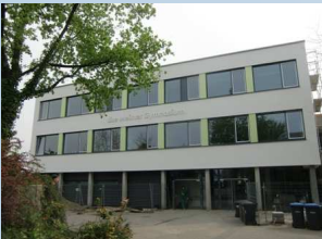
Luise Meitner Gymnasium in Neuenhaus