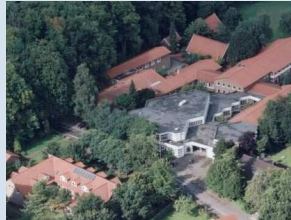
Ludwig - Windhorst - Haus in Lingen