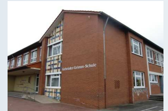
Gemeinde Geeste Gebr. Grimm Schule, Osterbrock