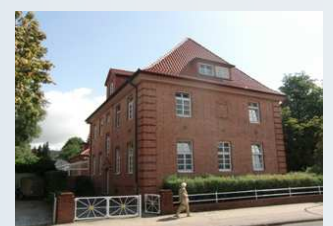
Verein Lotse e.V. Liegenschaft in Meppen