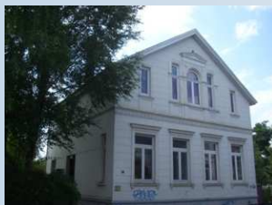
Wohn und Geschäftshaus in Oldenburg

500 m 2 Dämmhülsenverfahren, mit Zellulose Einblasdämmung